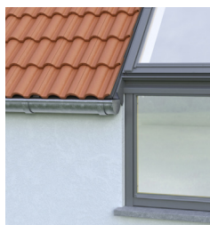
Zakončení střešky v linii obvodové zdi bez přesahu