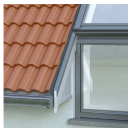
Střešní rovina s přesahem vnější obvodové zdi

*V závislosti na velikosti horních otvíracích střešních oken