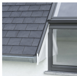
Střešní rovina s přesahem vnější obvodové zdi

*V závislosti na velikosti horních otvíravých střešních oken