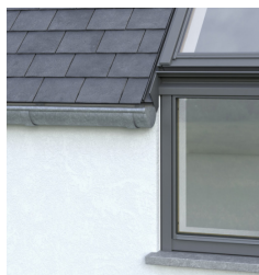
Zakončení střechy v linii obvodové zdi bez přesahu